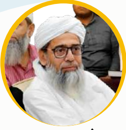
حضرت داعی اسلام شیخ ابوسعید محمدی صفوی دام ظلہ العالی زیب سجادہ خاتقاہ عالیہ عارفیہ، سید سراواں شریف، انڈیا