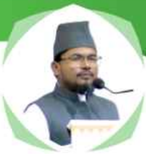
مفتی امام الدین سعیدی