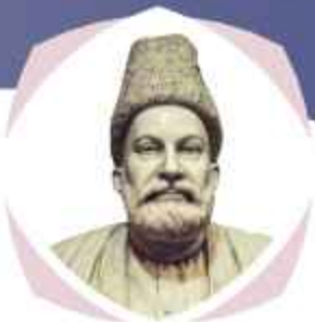
مرزا اسد اللہ خاں غالب